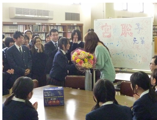
生徒会から花束を贈呈